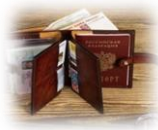
Документы, деньги, иные ценности